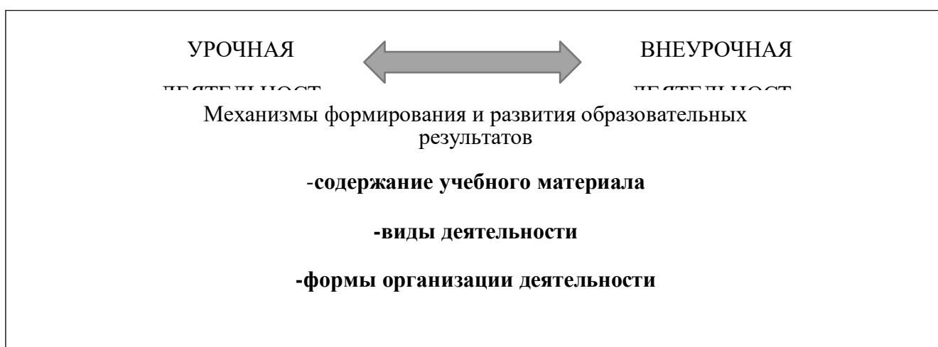
Рис.1 Механизмы формирования и развития образовательных результатов

Личностные, предметные и метапредметные результаты достигаются в образовательном пространстве МОУ ВШ №10 в единстве урочной и внеурочной деятельности. Характеристика личностных, метапредметных и предметных результатов отражена в рабочих программах учебных предметов, учебных курсов (в том числе курсов внеурочной деятельности).